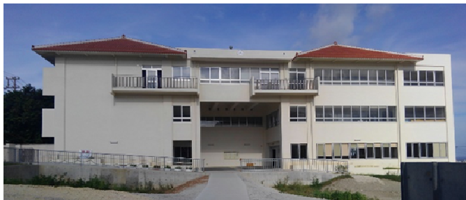
新管理棟(平成30年度落成)