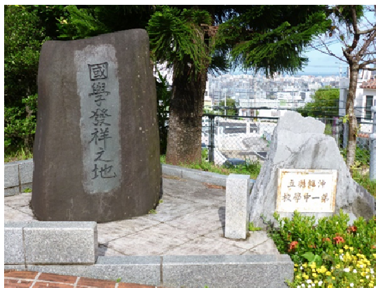
国学発祥之地の碑