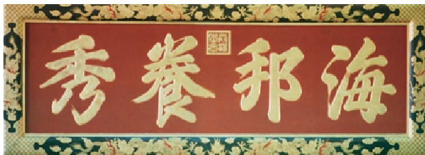
「国学」創建の際、尚温王揮毫の扁額