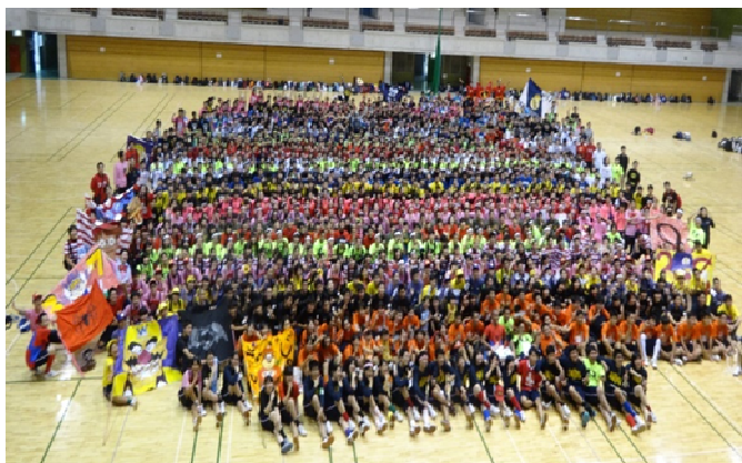
令和元年度 在校生