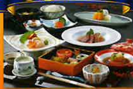
ホテル華の湯夕食