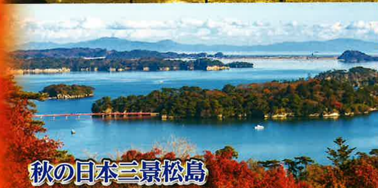
秋の日本三景松島