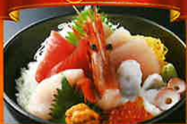
気仙沼の海鮮料理